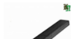
Полоса, арт. 12601П 3000x12x6мм Вес: 1.7 кг Цена (за штуку): 250 руб.