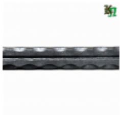
Полоса, арт. 12602П 3000x12x6мм Вес: 1.7 кг Цена (за штуку): 270 руб.