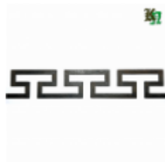
Декоративный прокат, полоса, арт. 824 1200х95х2,5мм Вес: 1.2 кг Цена (за штуку): 490 руб.