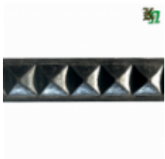
Полоса, арт. 32901П 3000x32x9мм Вес: 3.35 кг Цена (за штуку): 1 600 руб.