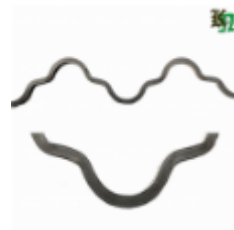
Монастырская вязь, арт. 180 1650мм, кв.12х12мм Вес: 2.26 кг Цена (за штуку): 450 руб.