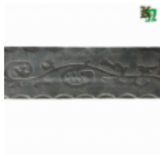
Полоса, арт. 40404П 3000x40x4мм Вес: 4.3 кг Цена (за штуку): 475 руб.