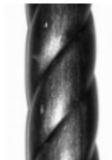
Витая труба, арт. Труба витая 89 3000мм, д=89x2,5мм Вес: 13.2 кг нет в наличии