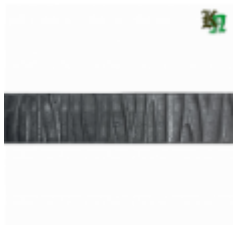
Полоса, арт. 20403П 3000x20x4мм Вес: 2.17 кг Цена (за штуку): 350 руб.