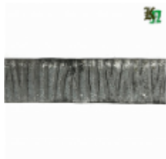
Полоса, арт. 30411П 3000x30x4мм Вес: 2.8 кг Цена (за штуку): 425 руб.