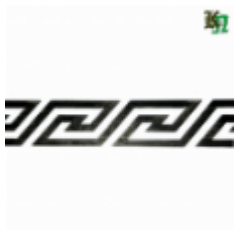
Декоративный прокат, полоса, арт. 820 1200х95х2.5мм Вес: 1.2 кг Цена (за штуку): 480 руб.