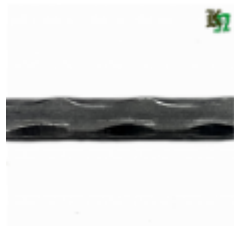
Квадрат, арт. 12Д5 3000мм, кв.12x12мм Вес: 3.43 кг Цена (за штуку): 540 руб.