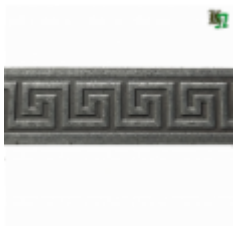
Полоса, арт. 40412П 3000x40x4мм Вес: 4.3 кг Цена (за штуку): 490 руб.