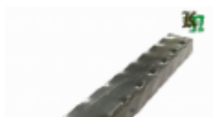
Труба профильная, арт. 60602T 3000x60x60мм Вес: 9.8 кг Цена (за штуку): 1 200 руб.