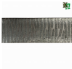
Полоса, арт. 50511П 3000x50x5мм Вес: 5 кг Цена (за штуку): 600 руб.