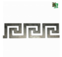
Декоративный прокат, полоса, арт. 827 1200х95х2мм Вес: 1.2 кг Цена (за штуку): 550 руб.