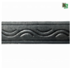
Полоса, арт. 40406П 3000x40x4мм Вес: 4.3 кг Цена (за штуку): 475 руб.