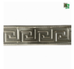
Декоративный прокат, полоса, арт. 412.26 2500х80х1мм Вес: 1.37 кг Цена (за штуку): 650 руб.