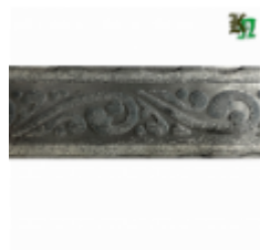
Полоса, арт. 50507П 3000x50x5мм Вес: 5 кг Цена (за штуку): 600 руб.