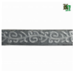
Полоса, арт. 20404П 3000x20x4мм Вес: 2.17 кг нет в наличии