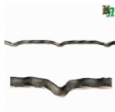
Квадрат для решетки, обжатый, арт. 178 1900мм, кв.12x12мм Вес: 2.14 кг нет в наличии