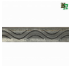
Полоса, арт. 20401П 3000x20x4мм Вес: 2.17 кг Цена (за штуку): 350 руб.