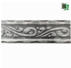
Полоса, арт. 40407П 3000x40x4мм Вес: 4.3 кг Цена (за штуку): 475 руб.