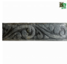
Полоса, арт. 30407П 3000x30x4мм Вес: 2.8 кг Цена (за штуку): 425 руб.