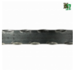
Полоса, арт. 20402П 2930x20x4 Вес: 2.2 кг Цена (за штуку): 320 руб.