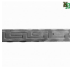
Полоса, арт. 40408 3000x40x4мм Вес: 4.3 кг Цена (за штуку): 400 руб.