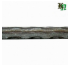
Квадрат, арт. 10Д2 3000мм, кв.10x10мм Вес: 2.38 кг Цена (за штуку): 320 руб.