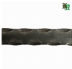
Полоса, арт. 25401П 3000x25x4 Вес: 2.4 кг Цена (за штуку): 380 руб.