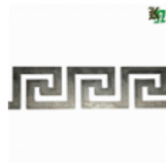
Декоративный прокат, полоса, арт. 826 1200х80х2мм Вес: 1.2 кг Цена (за штуку): 460 руб.