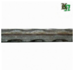
Квадрат, арт. 12Д2 3000мм, кв.12x12мм Вес: 3.43 кг Цена (за штуку): 480 руб.