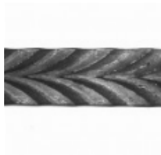
Полоса, арт. 32501П 3000x32x4мм Вес: 3.35 кг Цена (за штуку): 1 250 руб.