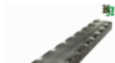
Труба профильная, арт. 40202T 3000x40x20мм Вес: 3.9 кг Цена (за штуку): 600 руб.