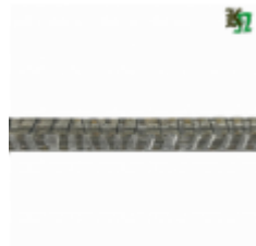
Квадрат, арт. 12Д3 3000мм, кв.12x12мм Вес: 3.43 кг Цена (за штуку): 480 руб.