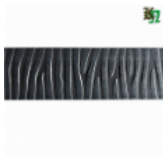
Полоса, арт. 40411П 3000x40x4мм Вес: 4.3 кг Цена (за штуку): 475 руб.