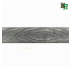
Полоса, арт. 25409П 3000x25x4 Вес: 2.4 кг Цена (за штуку): 390 руб.