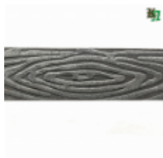
Полоса, арт. 40409П 3000x40x4мм Вес: 4.3 кг Цена (за штуку): 490 руб.